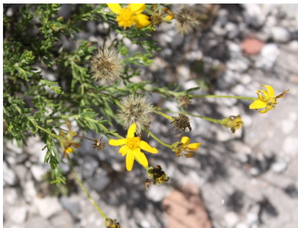
A. Planta que presentan de manera sincrónica flores y frutos