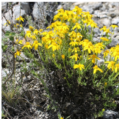
A. Hábito arbustivo.

En cuanto a sus caracteres morfológicos diagnósticos, C. mexicana se distingue por ser arbustos de tamaño pequeño (20-40 cm de alto) (Fig. 1A), con hojas pequeñas (5-20 mm de largo y de 1-2 mm de ancho), alternas, simples, lineares y succulentas. Se destaca la presencia de glándulas notorias en sus hojas, las cuales contienen aceites esenciales (Fig. 1B). Las inflorescencias son cabezuelas de 4-5 mm de alto, usualmente con 13 flores liguladas amarillas (Fig. 1C). Los frutos son aquenios estriados, de 3-4 mm de largo, cilíndricos (Fig. 1D) (Villareal, 2003).