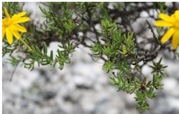
B. Hojas con glándulas notorias, las cuales contiene aceites esenciales.