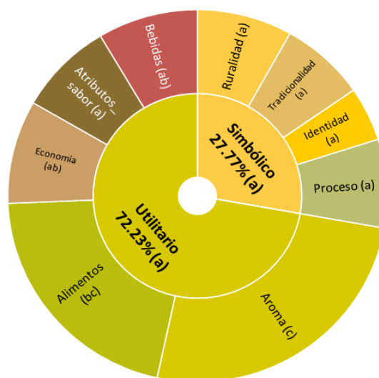
Fig. 1. Rueda de significados para consumidores de vainilla y comparación de las comunalidades.

El análisis de significados muestra que la dimensión utilitaria representa el 72.23% de la percepción de los consumidores, mientras que el 27.77% corresponde a la dimensión simbólica. Dentro de la dimensión utilitaria las categorías de aroma (25.64%) y alimento (20.94%) registraron un mayor porcentaje, lo cual indica que tienen un mayor significado para los consumidores, seguido de las categorías de economía (8.97%), bebida (8.55%) y atributos (8.12%); en la dimensión simbólica, destacan con un menor porcentaje las categorías de ruralidad (8.12%), proceso (7.69%), tradicionalidad (7.26%) e identidad (4.27%) (Fig. 1).