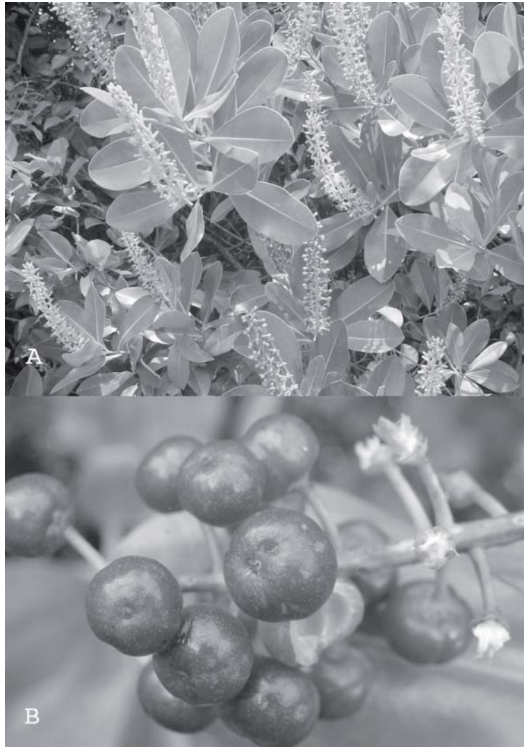
Fig. 1. Souroubea loczyi (V.A. Richt.) De Roon ssp. loczyi de Roon. A) ramas floríferas general e inflorescencias ( E. Endañú Huerta 997, CICY, MEXU); B) frutos ( E. Endañú Huerta 1216, CICY, MEXU).