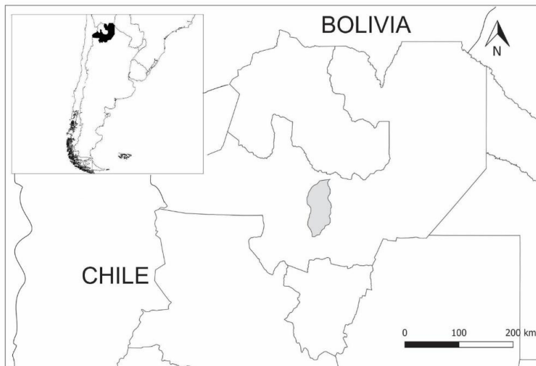
Fig. 1. Ubicación del Valle de Lerma en la provincia de Salta, Argentina.

El material estudiado proviene del Valle de Lerma (Salta, Argentina) (fig. 1), corresponde a colectas realizadas por los autores y a ejemplares depositados en los herbarios BAB, CORD, LIL, LP, MCNS y SI (Thiers, en constante actualización).