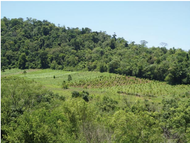
Fig. 8. Los cultivos se encuentran en sitios abiertos, entre el bosque primario y el bosque de galería.