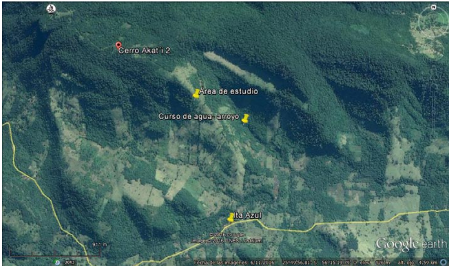
Fig. 1. Ubicación del cerro Akatí 2 en la cordillera de Ybytyruzú.