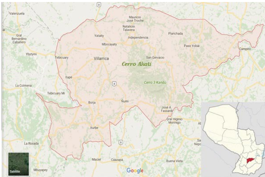
Fig. 2. Ubicación de Colonia Independencia en el Departamento de Guairá.