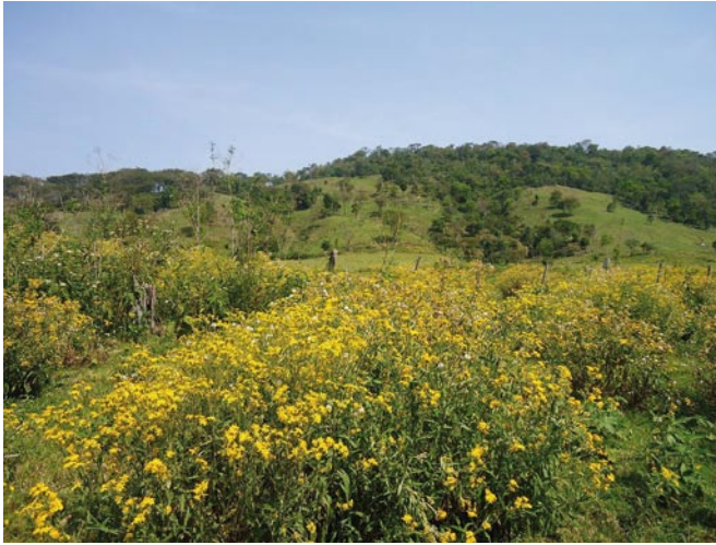
Fig. 9. Sitios modificados, con “agosto poty”, Senecio grisebachii .

chystachya y en ciertas épocas los campos destinados para la ganadería son invadidos por algunas especies como el “agosto poty”, Senecio grisebachii (fig. 10), “ka’a mará”, Lantana camara , formando matas y cubriendo grandes áreas.