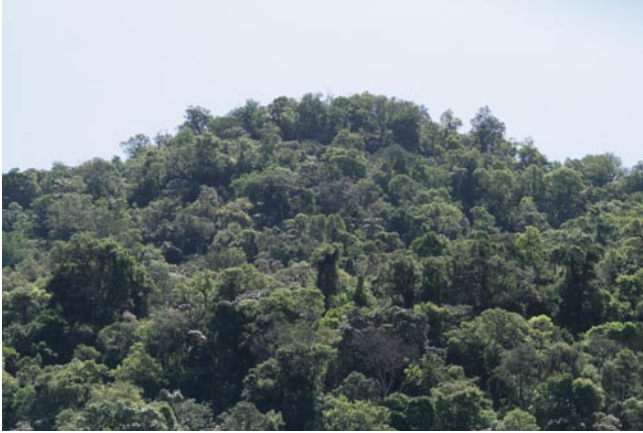
Fig. 6. Vista de la parte alta del bosque alto natural primario del cerro Acati-2.