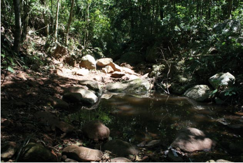
Fig.7. Bosque marginal, el curso bordea la ladera del cerro Acatí-2.