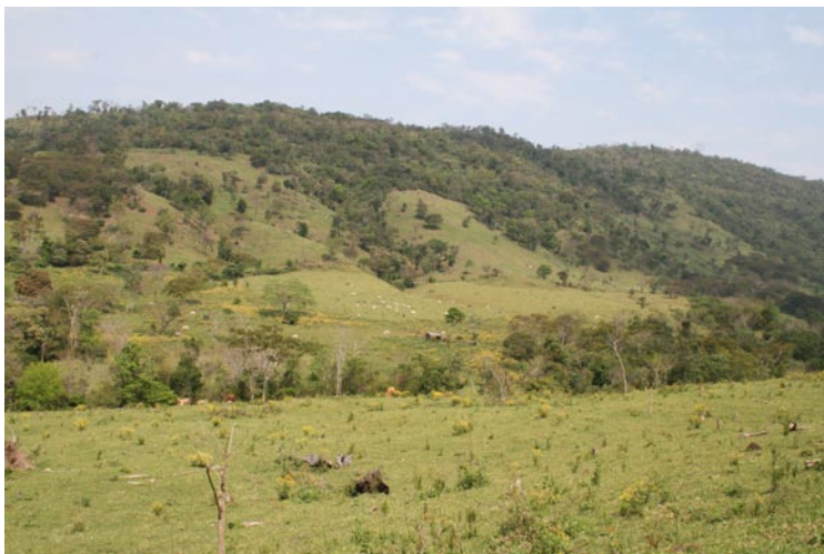
Fig. 10. En los sitios con mayor incidencia de luz se puede observar el uso de la tierra para ganado y cultivos.

a escala nacional, regional y global. San Rafael alberga una amplia diversidad de ambientes que varían desde densos bosques sobre grandes pendientes hasta extensos pastizales naturales y representa uno de los ecosistemas más amenazados por la deforestación, hasta 2002 se tienen registros de 322 especies; mientras que en este trabajo, en un área menor, se han encontrado 176 especies, resultado que permite sugerir que representa un valor muy importante de biodiversidad y podría ser considerado para contribuir con la conservación de los recursos naturales.