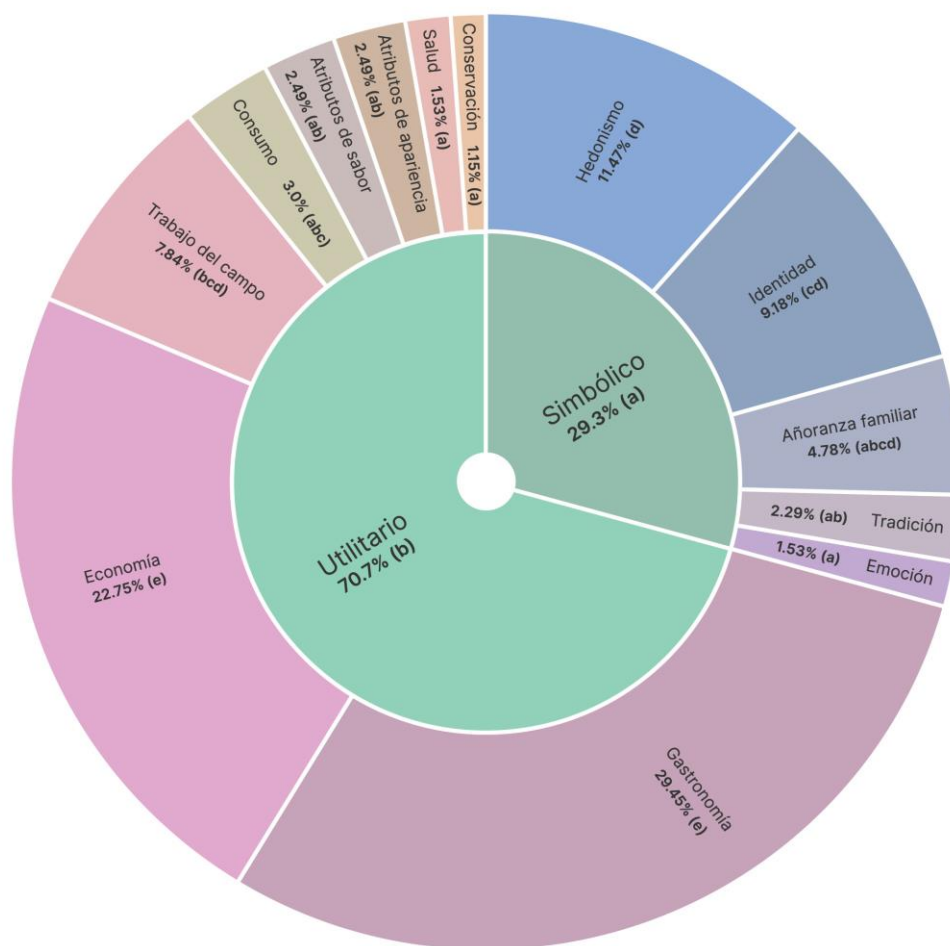
Fig. 3. Porcentajes de las comunalidades de categorías de significados del guaje rojo y sus aportaciones a los significados psicológicos. a,b,c, Porcentajes de comunalidades de significados con diferentes letras son estadísticamente diferentes.

La Fig. 3 muestra que los significados psicológicos utilitarios (70.7%) fueron significativamente ( p < 0.0001 ) mayores que los significados psicológicos simbólicos (29.3%). Las mayores comunalidades de los significados psicológicos utilitarios correspondieron a gastronomía (29.45%) y a economía (22.75%). Las menores comunalidades de los significados fueron trabajo de campo, consumo, atributos de sabor, atributos de apariencia, salud y conservación. Para el caso de los significados psicológicos simbólicos las mayores comunalidades fueron hedonismo (11.47%) e identidad (9.18%) y las de menor porcentaje fueron añoranza familiar (4.78 %), tradición (2.29%) y emoción (1.53%).