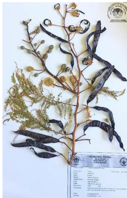
Fig. 2. Leucaena esculenta (DC) Benth