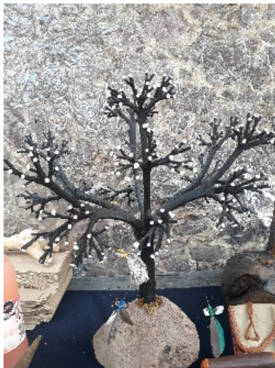
Fig. 3. “Arbolitos” elaborados con el escapo de varias especies de Agave spp.

En cuanto a las formas de vida, de los 19 taxa utilizados, el 52.63% fueron árboles y el 42.10% herbáceas. Martínez (2006) y Feuillet et al. , (2011) coinciden en que los árboles son los recursos más utilizados para la elaboración de artesanías, sin embargo, la mayor diversidad de usos no proviene de la madera. Los frutos e inflorescencias, así como las semillas son los recursos no maderables con mayor presencia en la elaboración de artesanías, 47 % y 16% respectivamente. Lo cual es evidenciado por el uso de recursos de la familia Pinaceae, en los bosques de pinos, en la Selva Baja Caducifolia con familias como Meliaceae y Bignoniaceae, y en los huertos familiares con las familias Fabaceae y Myrtaceae (CONAFORT, 2009; CONABIO, 2021); siendo esto últimos donde mayormente se obtienen de los recursos para la elaboración de las artesanías selva baja caducifolia 58% y huertos familiares 19% bosque de pinos 8% principalmente.