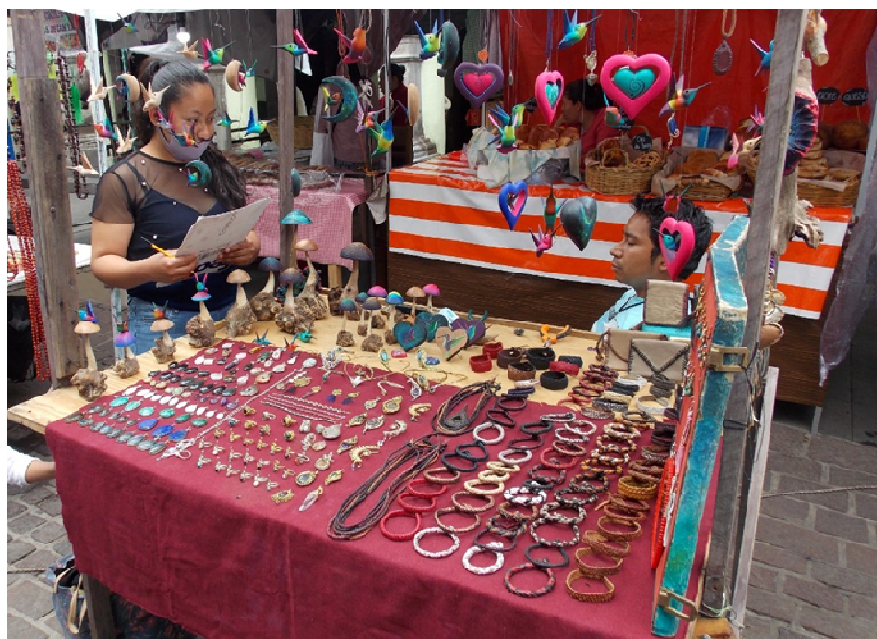
Fig. 1. Puesto de artesanías en la comunidad de Malinalco.

En la comunidad de Malinalco, se elaboran un promedio de 11 diferentes etnoartesanías; pulseras, collares, aretes, instrumentos musicales, diferentes adornos para decoración como flores, cortinas, lámparas, así como los denominados bules de agua, y exhibidores para sus artesanías y los denominados “arbolitos”; elaborados todos con recursos forestales no maderables. Este tipo de etnoartesanías son elaboradas y comercializadas por 20 artesanos, 17 artesanos y 03 artesanas de entre 17 y 59 años, con una experiencia de entre 5 a 30 años dedicados a esta actividad (Fig. 1).